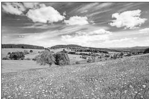
Frühlingsstimmung im ZweiTälerLand

Um den wichtigen Wirtschaftsfaktor Tourismus im ZweiTälerLand (ZTL) zu stärken und marktorientiert in die Zukunft zu führen, setzt die ZTL-Tourismusgesellschaft die Erstellung ihrer Tourismusstrategie 2030 fort. Im Rahmen mehrerer Workshops sind alle Interessierten eingeladen, ihre Ideen, wie der Tourismus im ZweiTälerLand zukünftig aussehen soll, einzubringen.