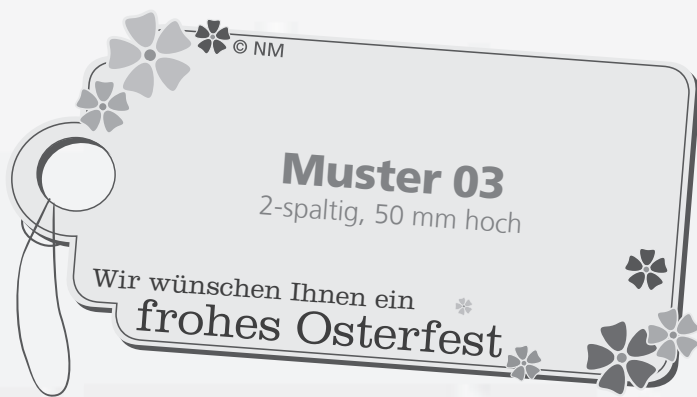
Muster 03 2-spaltig, 50 mm hoch