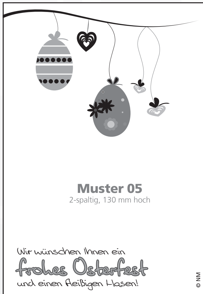
Muster 05 2-spaltig, 130 mm hoch

Wir wünschen Ihnen ein frohes Osterfest und einen fleißigen Hasen!