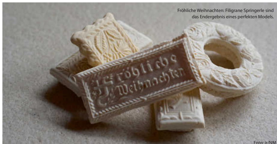
Fröhliche Weihnachten: Filigrane Springerle sind das Endergebnis eines perfekten Modells.

Es zeigt sich also: Die Weihnachtszeit in Baden-Württemberg ist nicht nur von malerischen Landschaften und festlich geschmückten Städten geprägt, sondern auch von einer kulinarischen Vielfalt, die Tradition und Genuss auf wunderbare Weise verbindet. Also nichts wie ans Backbuch, den Ofen, das Nudelholz und die Rührschüssel, und los geht das muntere Weihnachtsbacken. Zeit genug bis zum Fest ist ja noch. (jr)