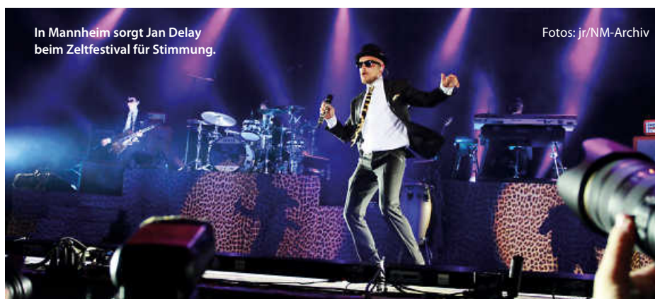
In Mannheim sorgt Jan Delay beim Zeltfestival für Stimmung.

Auf dem Hockenheimring, bereits traditionell Heimat musikalischer Groß-Events, gibt es dieses Jahr eine Premiere. Im Line-Up beim Glücksgeföhle-Festival: zahlreiche international und national bekannte Künstler. Unter anderem werden das Duo Milky Chance, Rapper Marteria, die Donots oder DJ Steve Aoki die Bühne am Hockenheimring rocken. Erhältlich sind sowohl Tages- als auch Wochenendtickets. Neben den Top-Acts hat auch der Rummel auf dem Festivalgelände einiges zu bieten. Bei Kartbahn, Yoga-Sessions, Open-Air-Kino und vielem mehr ist wohl für jeden was dabei. (jr/jer)