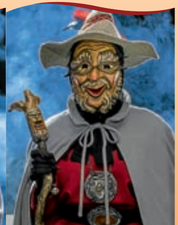
Bilder Silberklopfer: Helmut Kury