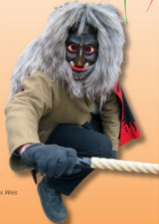
Bilder Leimedeyfel: Matthias Weis