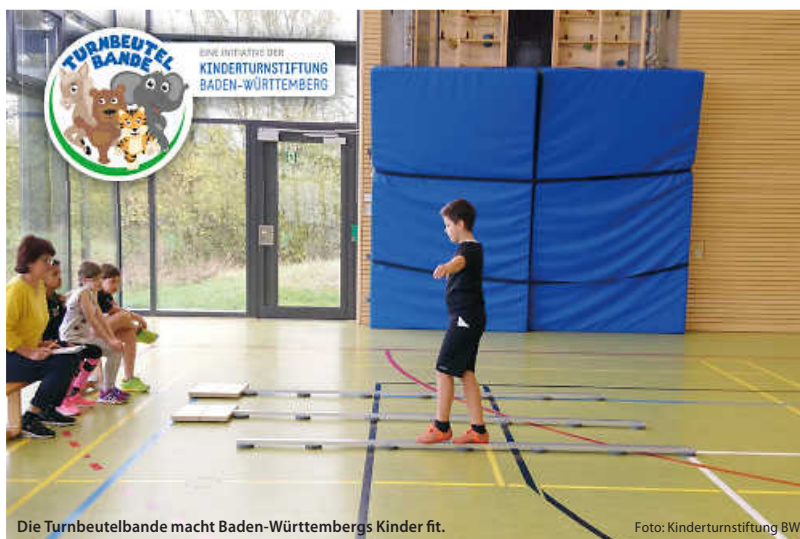
Die Turnbeutelbande macht Baden-Württembergs Kinder fit.

Für die fünf ersten Kommunen, die den Motoriktest für Kinder bei sich durchführen wollen, bietet die Kinderturnstiftung Baden-Württemberg eine kostenlose digitale Schulung an. Im Rahmen der etwa zweistündigen Veranstaltung wird der Test vorgestellt, und es werden Tipps zur erfolgreichen Organisation und Durchführung gegeben. (pm/red)