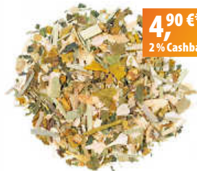
Florapharm Kräutertee Stressblocker