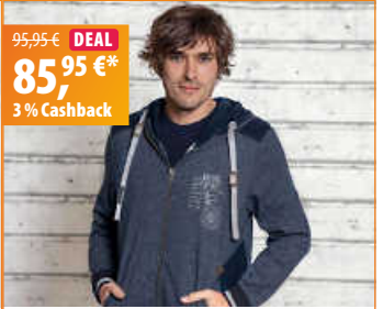
The Spirit of OM Sweatjacke - dunkelblau