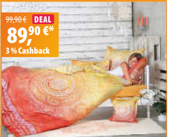
The Spirit of OM Bio-Bettwäsche Sunrise 135x200 cm