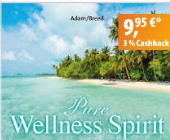
Adam/Breed Pure Wellness Spirit