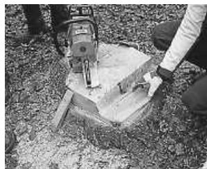
Nur fachkundig arbeiten – alles andere führt zu Unfällen.

Die aktuell hohe Holznachfrage und die damit einhergehenden derzeitigen hohen Holzpreise führen dazu, dass Kleinwaldbesitzer häufiger zur Motorsäge greifen. Die Sozialversicherung für Landwirtschaft, Forsten und Gartenbau (SVLFG) befürchtet dadurch höhere Unfallzahlen im Forst.