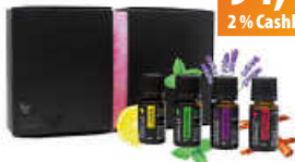
Forever Essential Oils Aromatherapie-Öle Combo Box