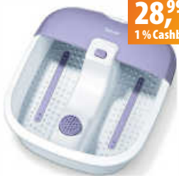
Beurer FB 12 Fußsprudelbad