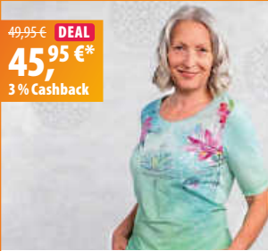
The Spirit of OM Shirt Waterlily - shiny lake