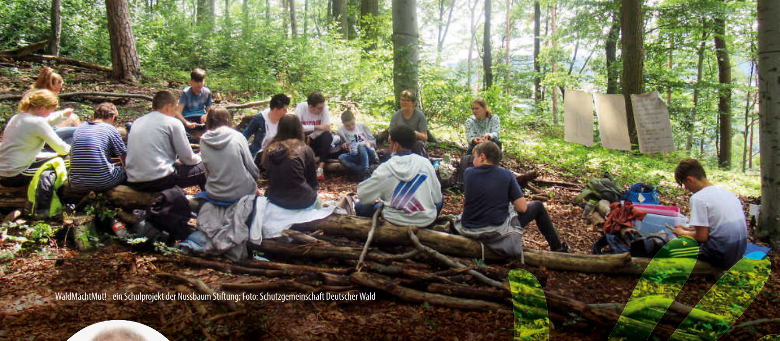
WaldMachtMut! - ein Schulprojekt der Nussbaum Stiftung; Foto: Schutzgemeinschaft Deutscher Wald