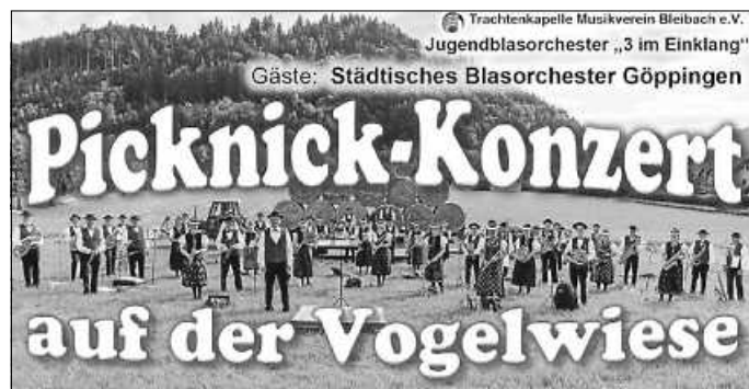
Picknickkonzert auf der Vogelwiese