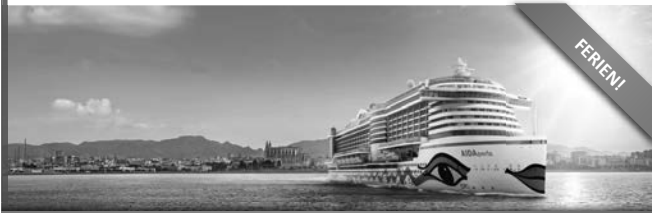
DAS NEUE FLAGGSCHIFF DER AIDA FLOTTE!

Ihre Reiseroute: Mallorca - Ajaccio - Rom/Civitavecchia - Florenz/Livorno - Barcelona - Mallorca