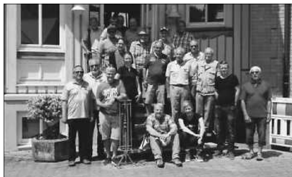
ZweiTälerLand Tourismus: Vorsitzende, Wegewarte und Wegewarte und ZTL

Durch die hervorragende Arbeit der zahlreichen ehrenamtlichen Wegemarkierer, die nun durch die Schulung aus- und weitergebildet wurden, soll das hohe Qualitätsversprechen gehalten werden. Ziel ist, im Januar 2022 das Zertifikat wieder überreicht zu bekommen.