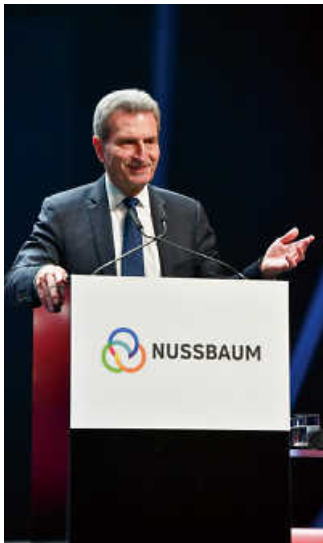
Auch Günther Oettinger (Ministerpräsident a.D.) gratulierte zum Jubiläum.