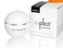
labiocomme Explicit Cell Connection