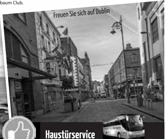
Freuen Sie sich auf Dublin