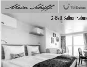
2-Bett Balkon Kabine