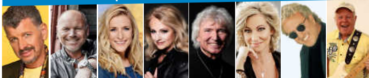
Semino Rossi, Olaf Henning, Stefanie Hertel, Nicole, Peter Orloff, Claudia Jung, Bernie Paul und Graham Bonney

Weitere Infos unter: www.schlager-kanaren.de