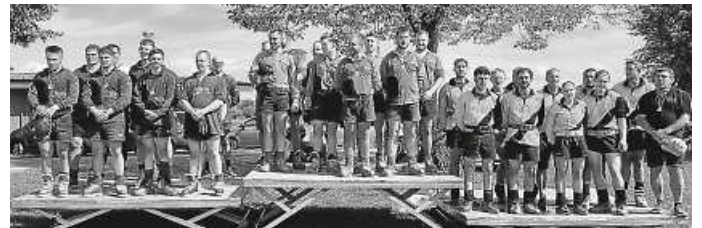
Siegerehrung Landesliga 2023