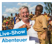
Live-Show Abenteuer Weltumrundung