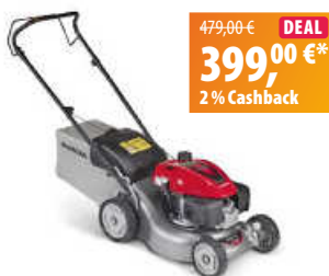
Honda Benzin-Rasenmäher HRG 416C1 PK