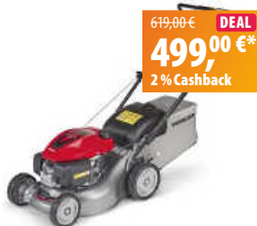
Honda Benzin-Rasenmäher HRG 416C1 SK