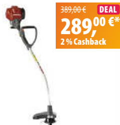
Honda Benzin-Rasentrimmer UMS 425