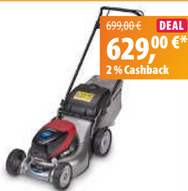
Honda Akku-Rasenmäher HRG 416 XB PE

Im breiten Sortiment findest du namhafte Marken wie Stihl, EGO, Kärcher und die Hausmarke Greenbase Kölle. Für alle, die sich nicht dauerhaft binden wollen, bietet der Fachmann Mietgeräte von der Heckenschere über Hochdruckreiniger bis hin zum Minibagger an.