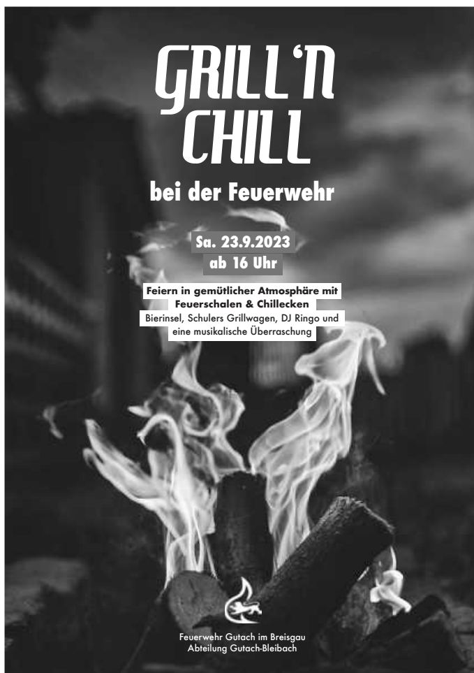
Plakat: Feuerwehr Gutach

Feuerwehrabteilung Gutach-Bleibach lädt ein zum „Grill ,n Chill“