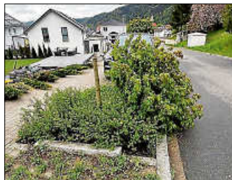
Alte Ziegelei, Bleibach