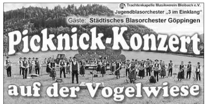
Picknick-Konzert auf der Vogelwiese