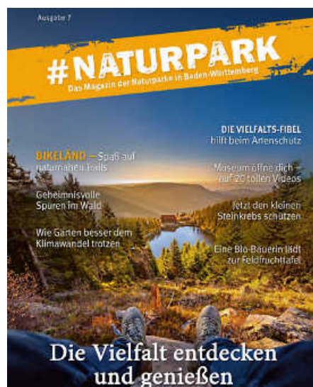
Das jährlich erscheinende Magazin #Naturpark beleuchtet nachhaltige Regionalentwicklung und kulturelles Erbe.

Rückkehr des Storchs im Naturpark Stromberg-Heuchelberg bieten besondere Einblicke. Mit den Blumen- und Genussworkshops im Naturpark Obere Donau oder den Veranstaltungen zum Limes-Jubiläum im Naturpark Schwäbisch-Fränkischer Wald sowie mit dem Bikeländ in Eberbach im Naturpark Neckartal-Odenwald liefert das Magazin Unternehmungstipps für Groß und Klein. In Sachen Genuss hat der Schwarzwald einiges zu bieten, wie man im Beitrag über das Videoprojekt der Naturpark-Wirte der beiden Schwarzwälder Naturparke erfährt. Einen Besuch wert sind auch stets die Naturpark-Zentren der sieben Naturparke – was man dort außer reiner Wissensvermittlung erleben kann, erfährt man ebenso auf vier der insgesamt 69 Seiten des Magazins. (pm/red)