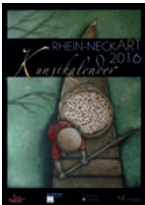
Titelseiten der Kunstkalender aus den Jahren 2012, 2014 und 2016