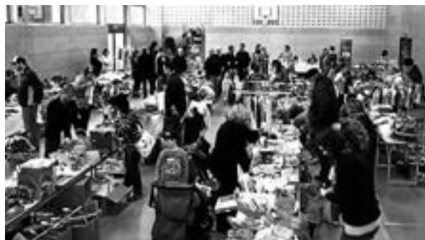
3. „Flohmarkt von A-Z“ in der Bleibacher Sporthalle

Das Kinderschminken wurde in diesem Jahr von 2 Mädels vom Jugendrotkreuz Bleibach übernommen, ein herzliches Dankeschön geht an sie. Des Weiteren gilt unser Dank den vielen fleißigen Helfern, die uns, dem Elternbeirat, beim Verkauf von Kaffee und Kuchen, Wurst und Weckle sowie den Getränken tatkräftig unterstützt haben. Ebenso ein herzliches Dankeschön für die Spenden , die wir für den Kindergarten erhalten haben.