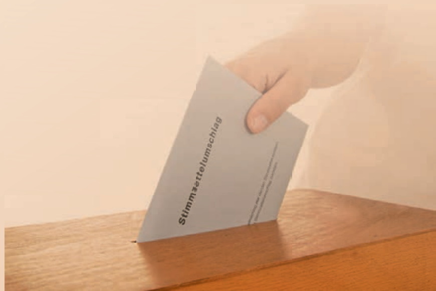
Urban Singler Bürgermeister