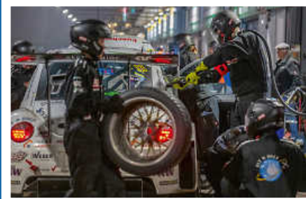
> Boxenstopp des Beetle RSR #13 in der Nacht

Jetzt über den QR-Code direkt mit dem Teamchef in Kontakt treten und das Projekt aktiv unterstützen!