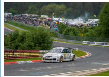
> Beetle RSR #13 in der Grünen Hölle