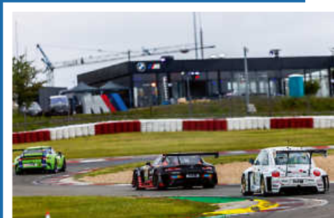
> Beetle RSR #13 in der Startphase des 24h Rennen.

Um das Projekt via PayPal direkt zu unterstützen den QR Code scannen.