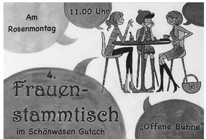
Plakat: N. Rieser